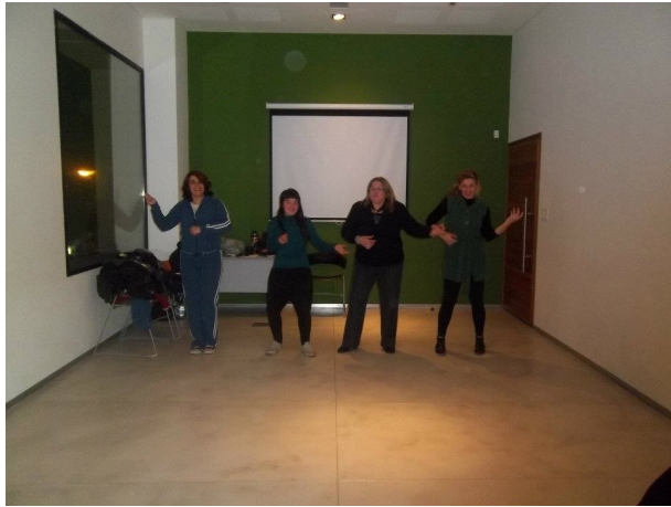
Danza “Cosa de Mininas”