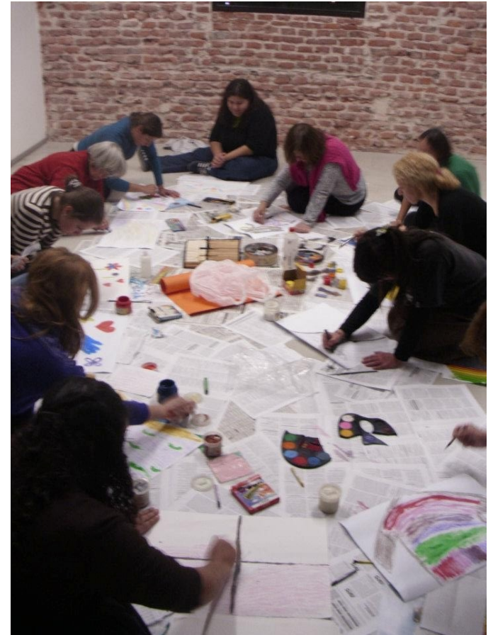
Declaracion de Identidad