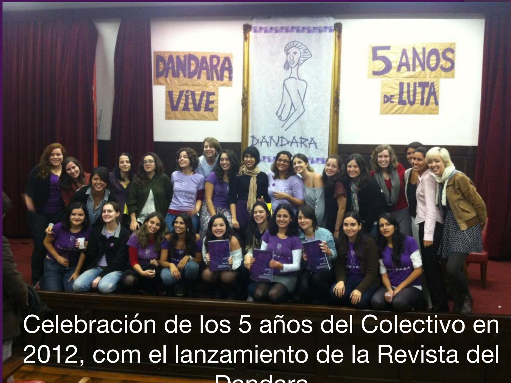
Celebración de los 5 años del Colectivo en 2012, com el lanzamiento de la Revista del Dandara