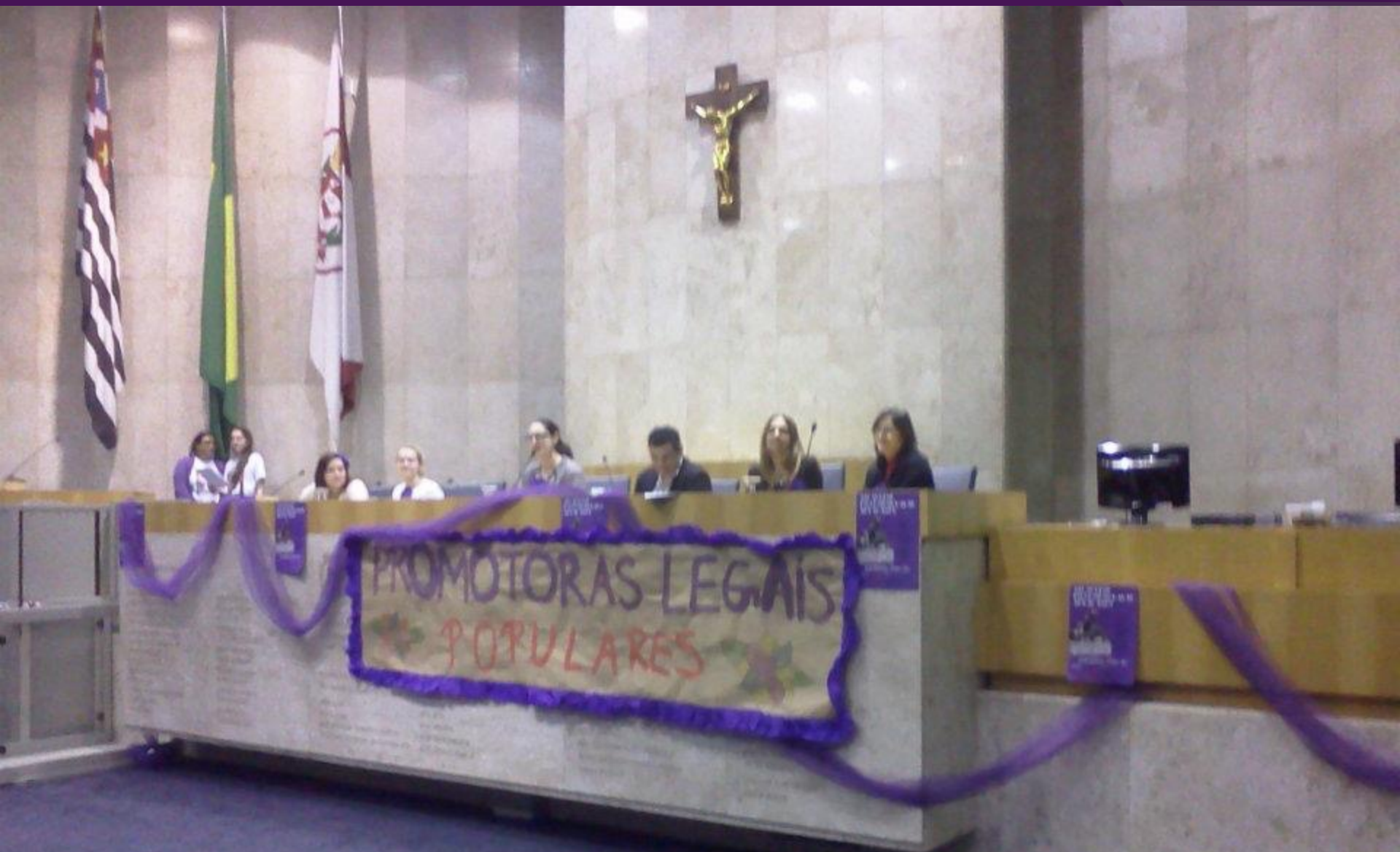
Cierre del curso en 2011, en la Cámara Municipal de Sao Paulo